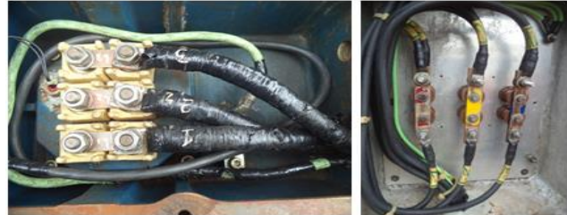
Fig. 3. Fotos de bornera y JB después de realizar limpieza y secado

Se revisó el motor en bornera y junction box en campo, se encontró bastante humedad por condensación en JB de potencia, lo cual se corrigió y se mejoró la impermeabilización de la caja.